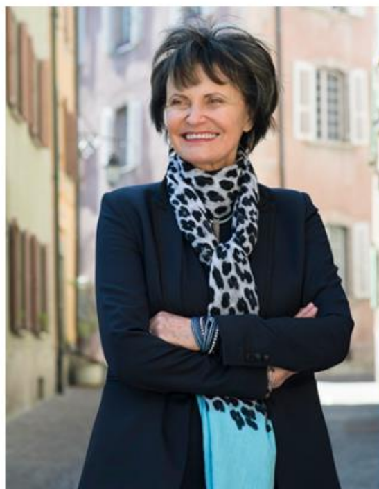
Micheline Calmy-Rey Ancienne présidente de la Confédération suisse, professeure invitée à l'Université de Genève (depuis mai 2012)