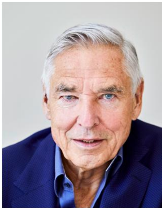
Peter Brabeck-Letmathe Président du conseil de fondation