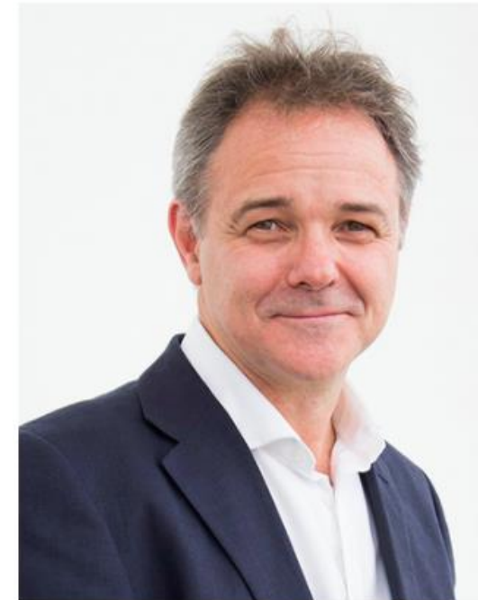
Sir Jeremy Farrar Directeur du Wellcome Trust