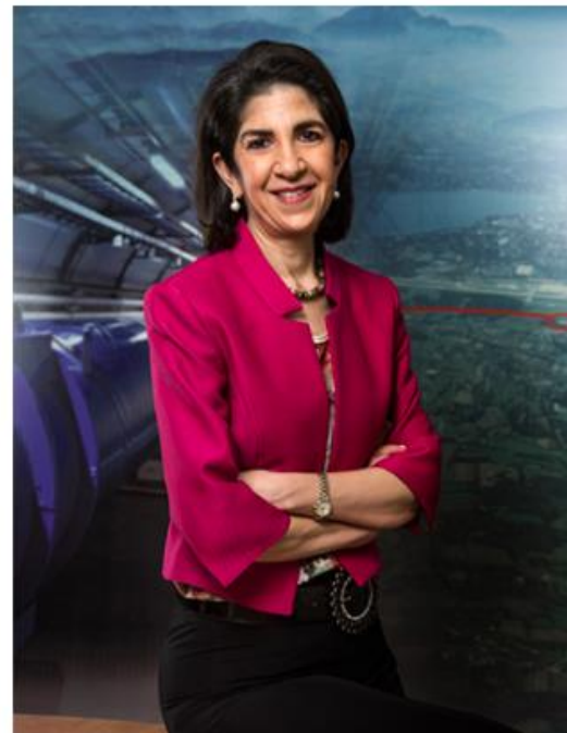
Fabiola Gianotti Directrice générale de l'Organisation européenne pour la recherche nucléaire (CERN)