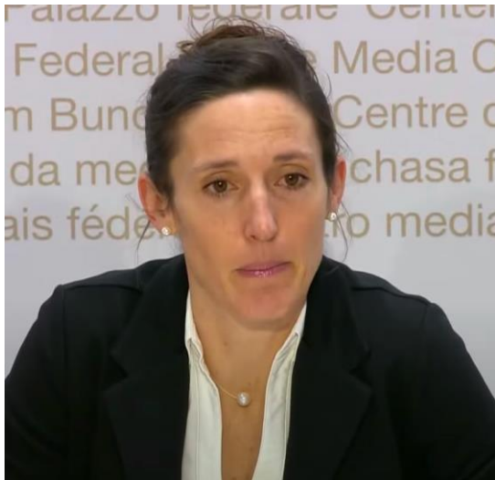
Tanja Stadler Présidente (depuis le 12.08.21)