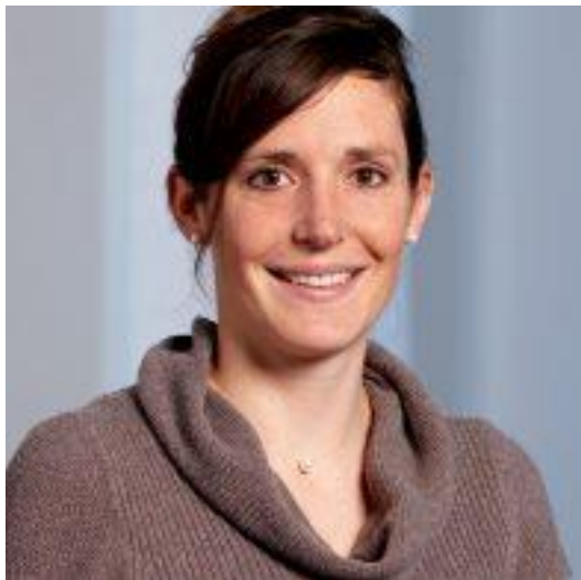
Tanja Stadler Présidente (depuis le 12.08.21)