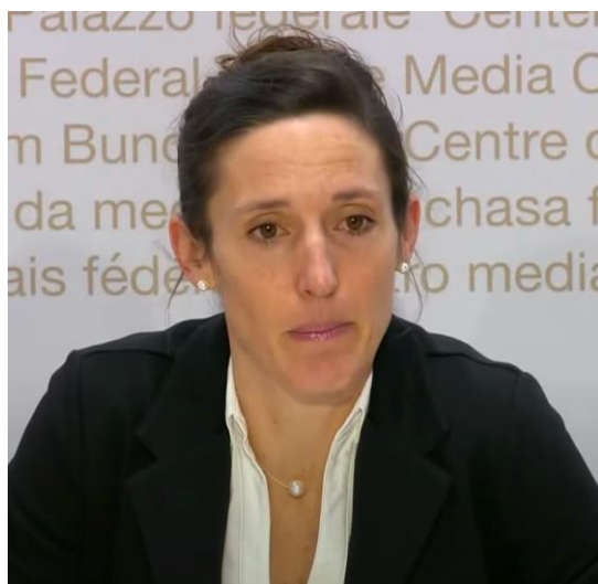
Tanja Stadler Présidente (depuis le 12.08.21)